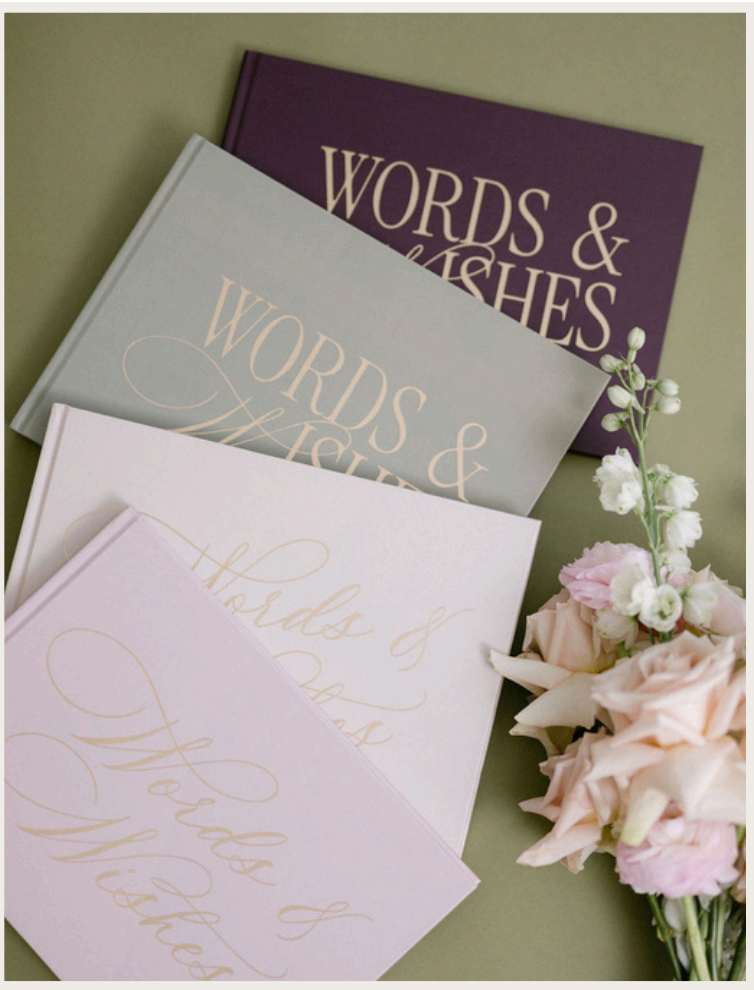
EMOTIONALE FREUNDEBUCH GÄSTEBÜCHER