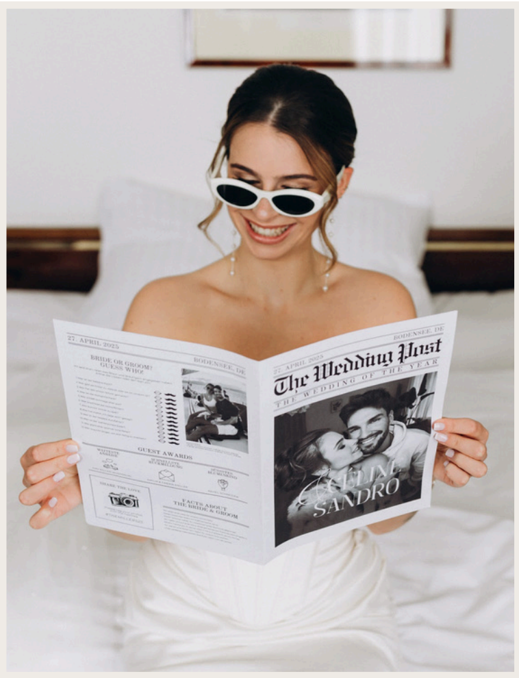
ELEGANTE HOCHZEITS ZEITUNGEN